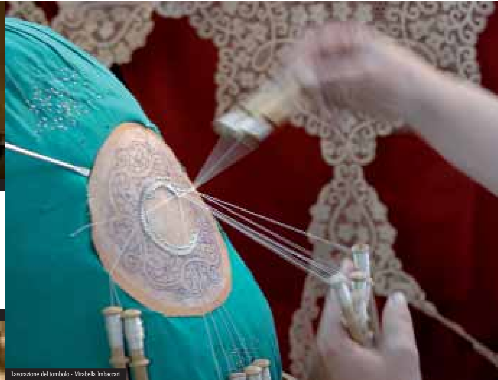
Lavorazione del tombolo - Mirabella Imbaccari

Oltre l'archeologia, l'arte, la storia, il patrimonio culturale e le bellezze naturali, il Calatino ha ancora molto da offrire. Una terra di sapori, aromi, prodotti genuini e tradizioni artigianali conosciuti e apprezzati in tutto il mondo. È difficile pensare all'arte della ceramica in Sicilia senza associarvi immediatamente il nome di Caltagirone. Ancora oggi antichi saperi, tramandati di generazione in generazione,