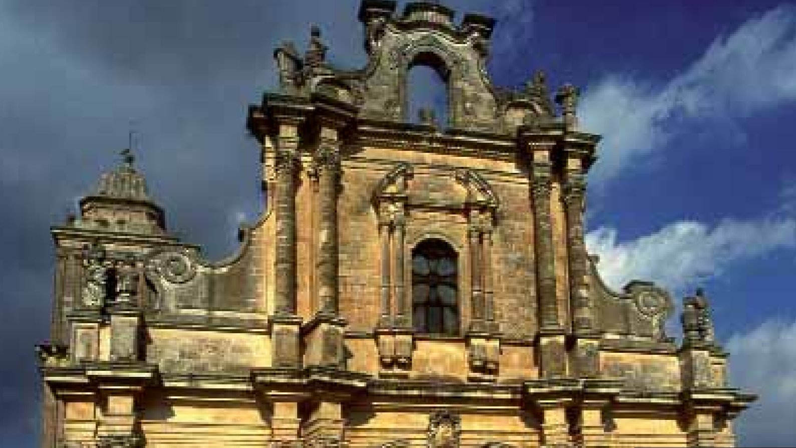
Chiesa di San Giovanni - Vizzini