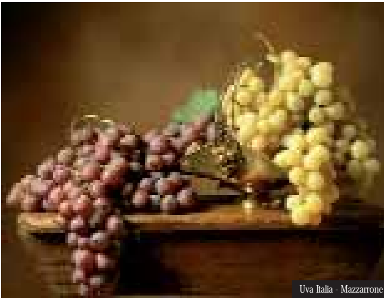
Uva Italia - Mazzarrone

Oltre l'archeologia, l'arte, la storia, il patrimonio culturale e le bellezze naturali, il Calatino ha ancora molto da offrire. Una terra di sapori, aromi, prodotti genuini e tradizioni artigianali conosciuti e apprezzati in tutto il mondo. È difficile pensare all'arte della ceramica in Sicilia senza associarvi immediatamente il nome di Caltagirone. Ancora oggi antichi saperi, tramandati di generazione in generazione,