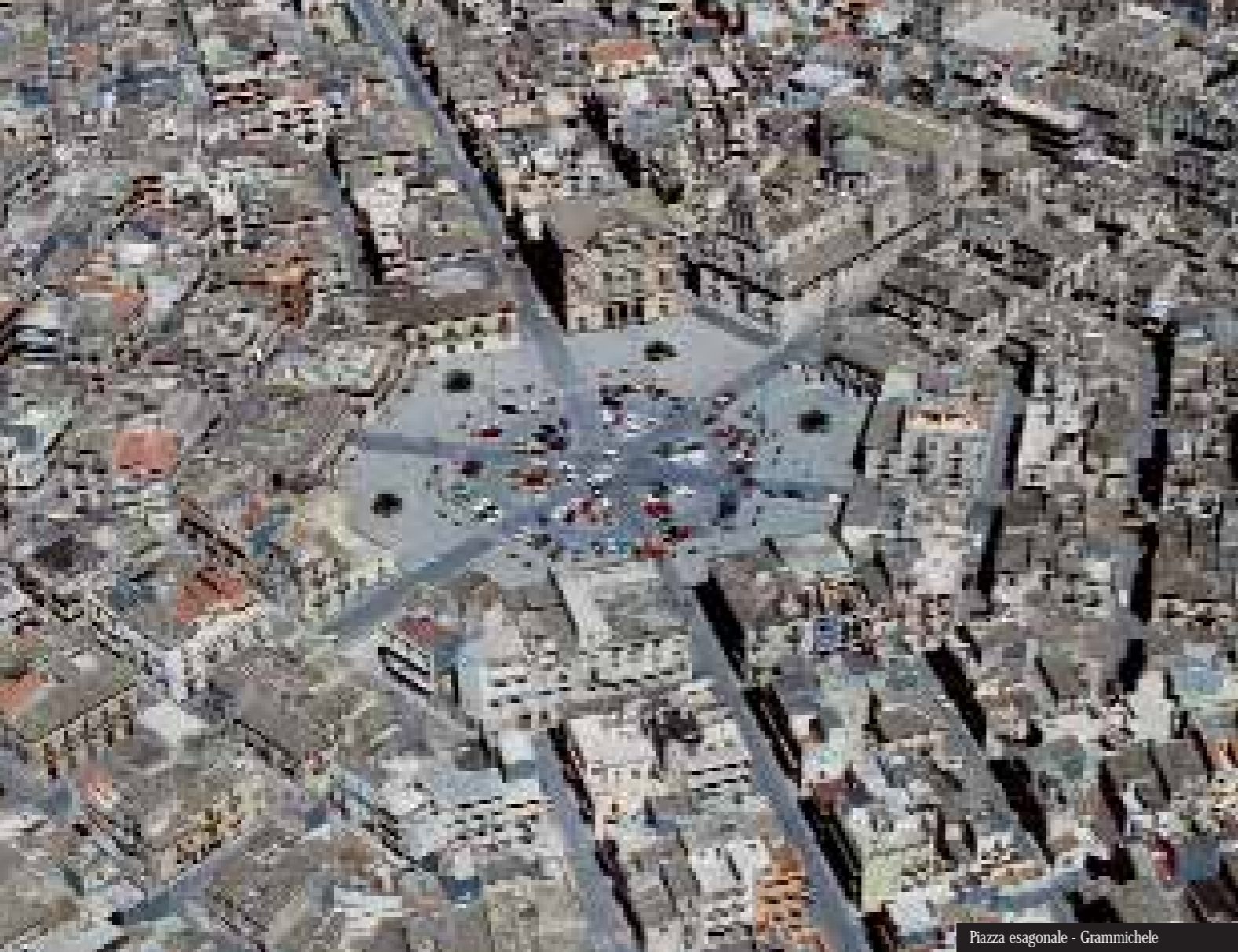
Piazza esagonale - Grammichele

La storia del Calatino Sud Simeto è segnata dal passaggio delle più importanti civiltà del Mediterraneo: Siculi, Greci, Romani, Arabi, Normanni, Svevi, Angioini e Aragonesi. Visitare questo territorio è come compiere un viaggio a ritroso nel tempo, alle origini della storia. Siti archeologici che sfidano l'inesorabile passare dei secoli si affiancano a esempi mirabili