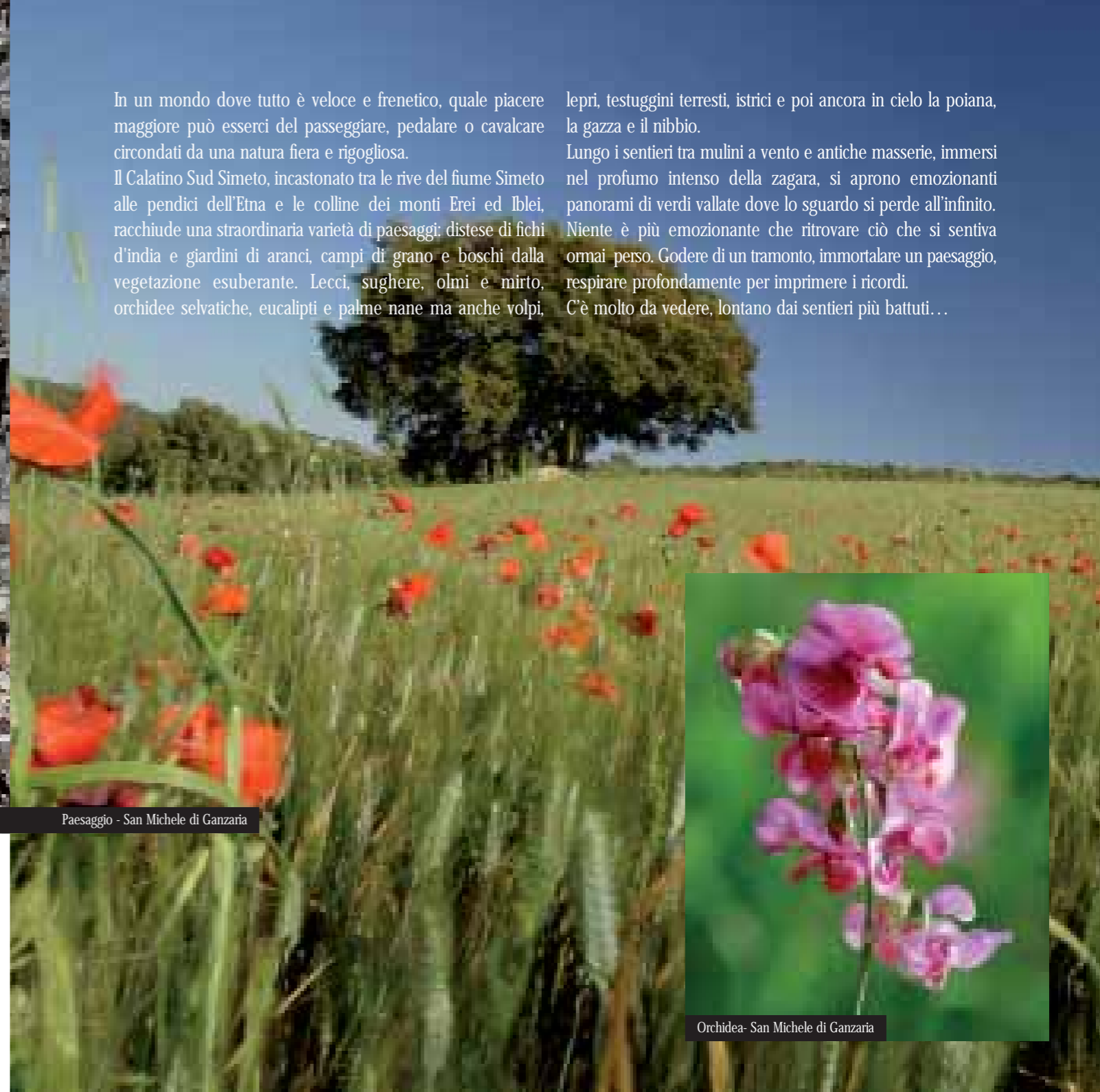
Paesaggio - San Michele di Ganzaria