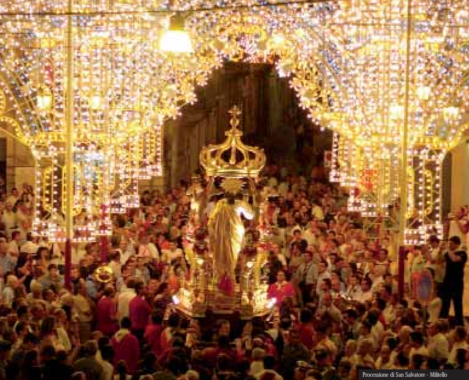
Processione di San Salvatore - Militello