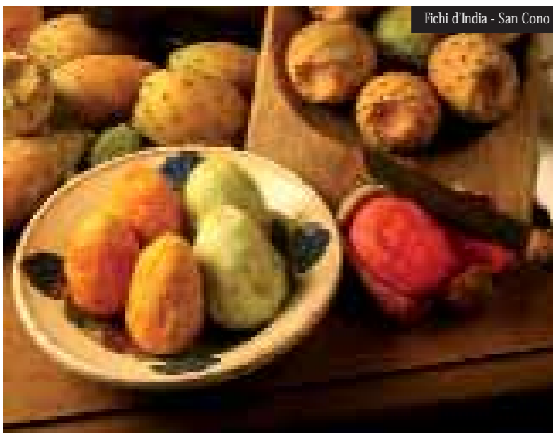
Fichi d'India - San Cono

Questi sono solo alcuni dei tesori gastronomici più preziosi di questa parte di Sicilia, una ricchezza straordinaria che si traduce in ricette squisite dal gusto unico e autentico. Questo scrigno di bellezze e bontà, preservato intatto nel cuore di Sicilia, non aspetta altro che catturare i tuoi sensi.