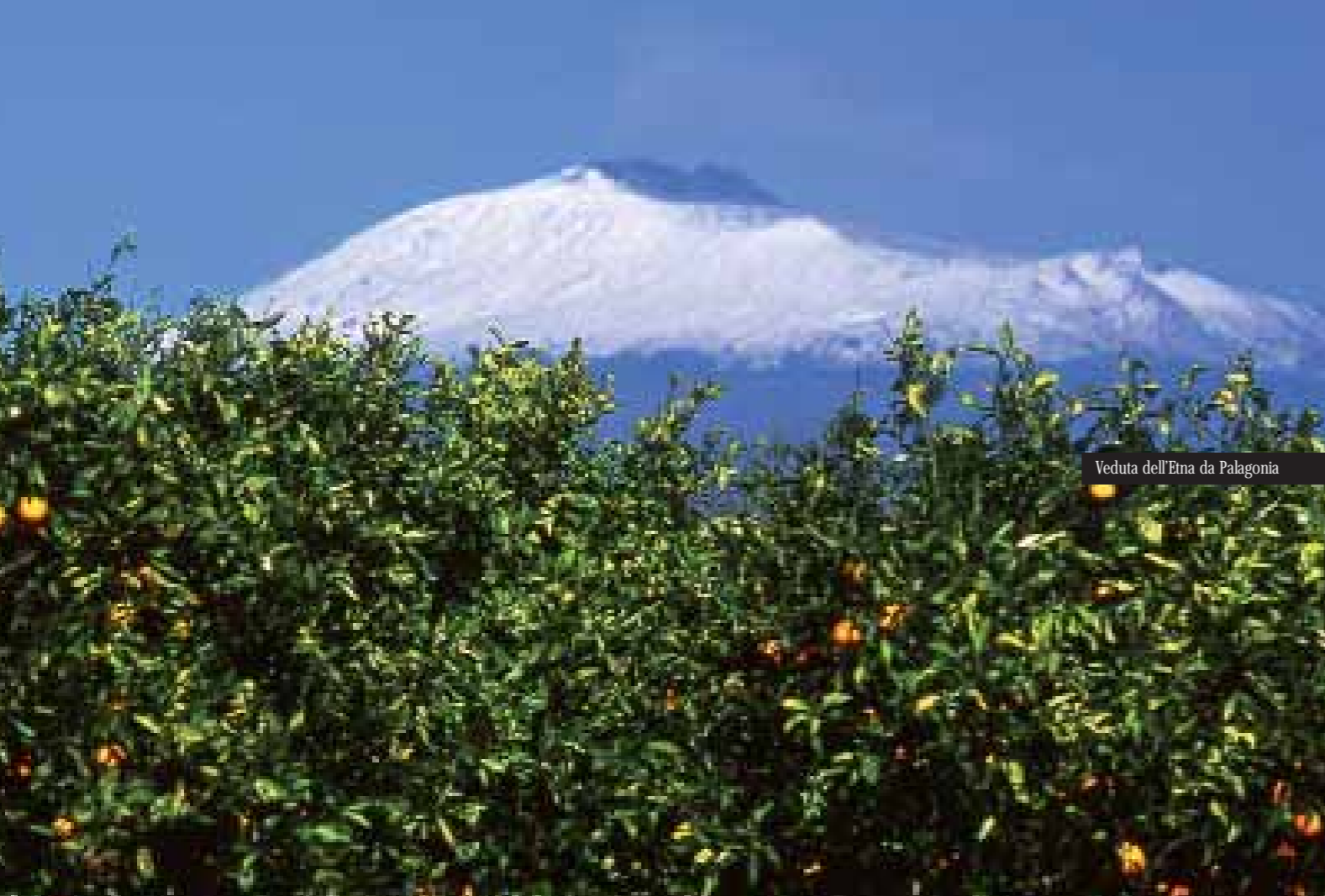
Veduta dell'Etna da Palagonia

“Il vero atto di scoperta non consiste nel trovare nuove terre ma nel guardare con occhi nuovi.” Marcel Proust