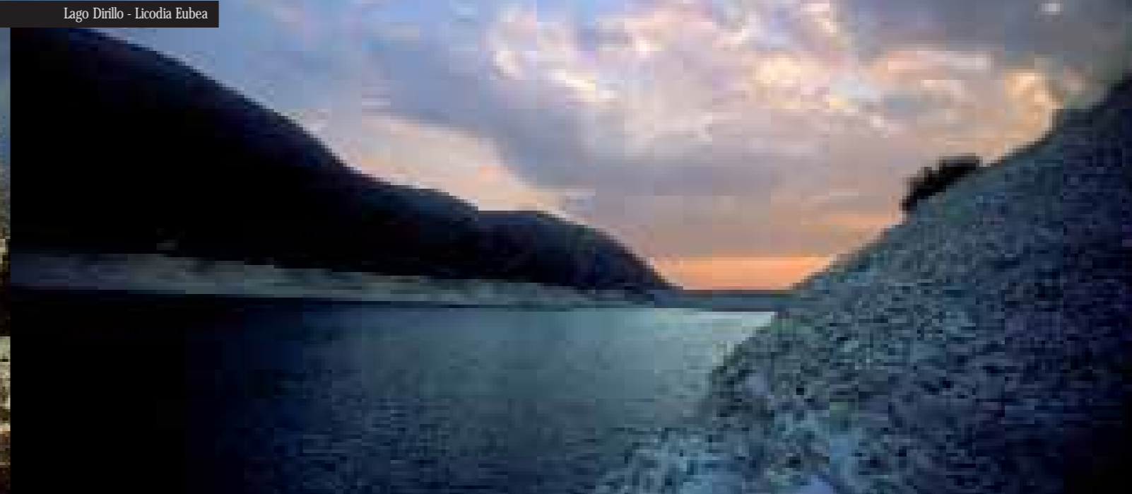
Lago Dirillo - Licodia Eubea

Per questo un viaggio nel Calatino Sud Simeto è qualcosa di più di una semplice vacanza. È restituire dignità e valore al tempo, in una dimensione che altrove sembra quasi perduta.