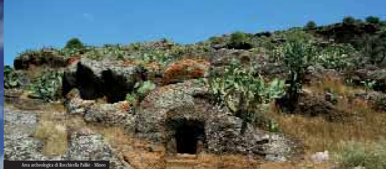
Area archeologica di Rocchicella Palikè - Mineo

Scoprire la bellezza in volti, gesti, colori, suoni e profumi del quotidiano è una magia che solo pochi luoghi, estranei al turismo di massa, sanno regalare.