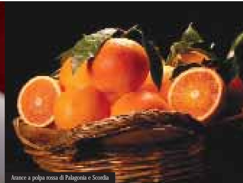
Arance a polpa rossa di Palagonia e Scordia

prendono forma e colore in oggetti dal gusto originale e inconfondibile, vere e proprie icone dello spirito del luogo. Spirito che si ritrova anche nella lavorazione del merletto al tombolo, arte di cui il paese di Mirabella Imbaccari è uno dei più gelosi custodi. Mani sapienti, con grazia e perizia d'altri tempi, decorano e impreziosiscono abiti e arredi con gusto e raffinatezza.