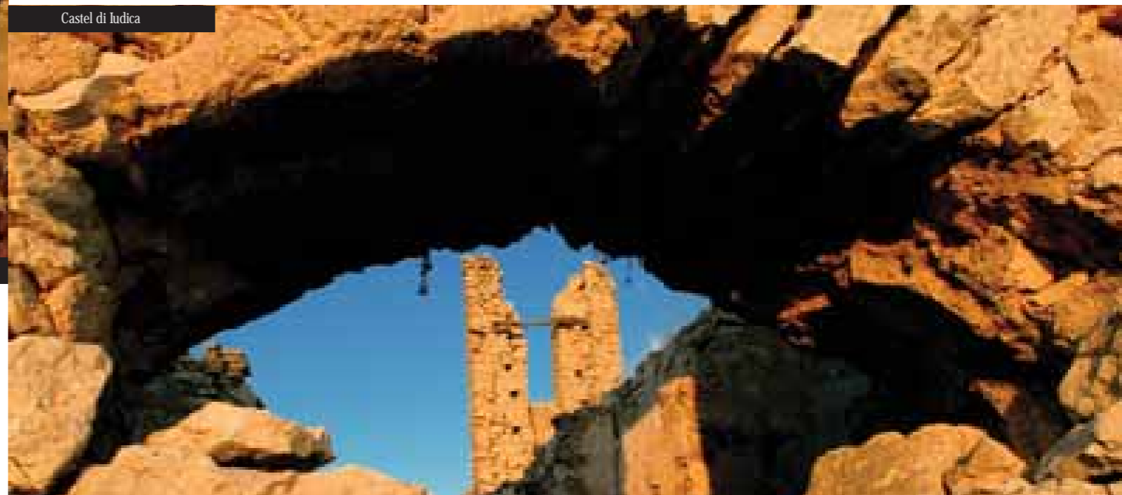
Castel di Iudica

fa poi il resto. Lasciati sedurre da questo viaggio nel viaggio, per tornare a sognare a occhi aperti.