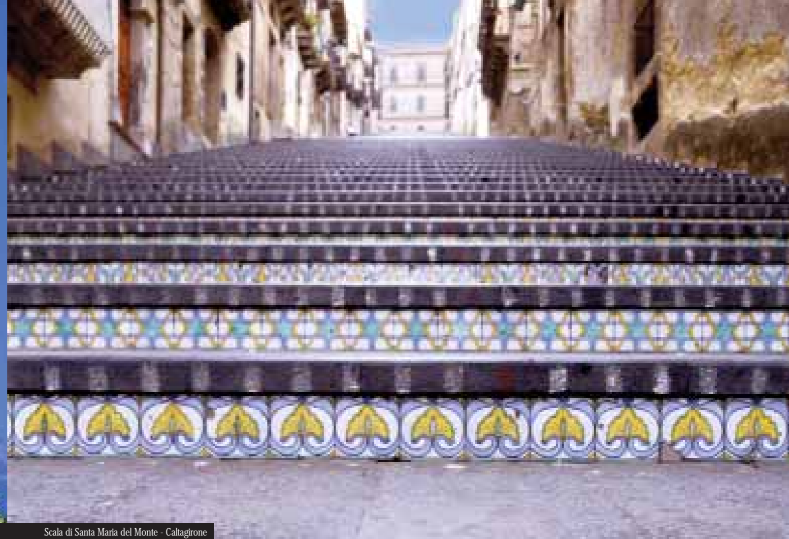
Scala di Santa Maria del Monte - Caltagirone

Viaggiare con lentezza è un lusso che non tutti possono permettersi. Perché la disponibilità del bene più prezioso per l'uomo moderno è proprio il tempo. Eppure è proprio questo modo d'intendere il viaggio quello che riserva le migliori sorprese. Il gusto della scoperta, lo stupore dell'inaspettato, il piacere del dettaglio.