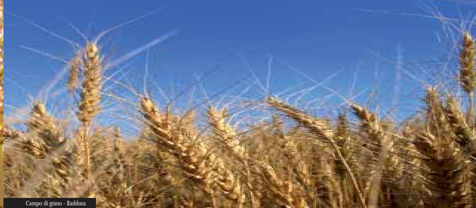
Campo di grano - Raddusa

Lunghi cortei, costumi, musiche e luci attraversano le piazze dei piccoli e grandi centri, trasformandoli in una tavolozza dai mille colori. Il calore e lo spirito della gente del luogo